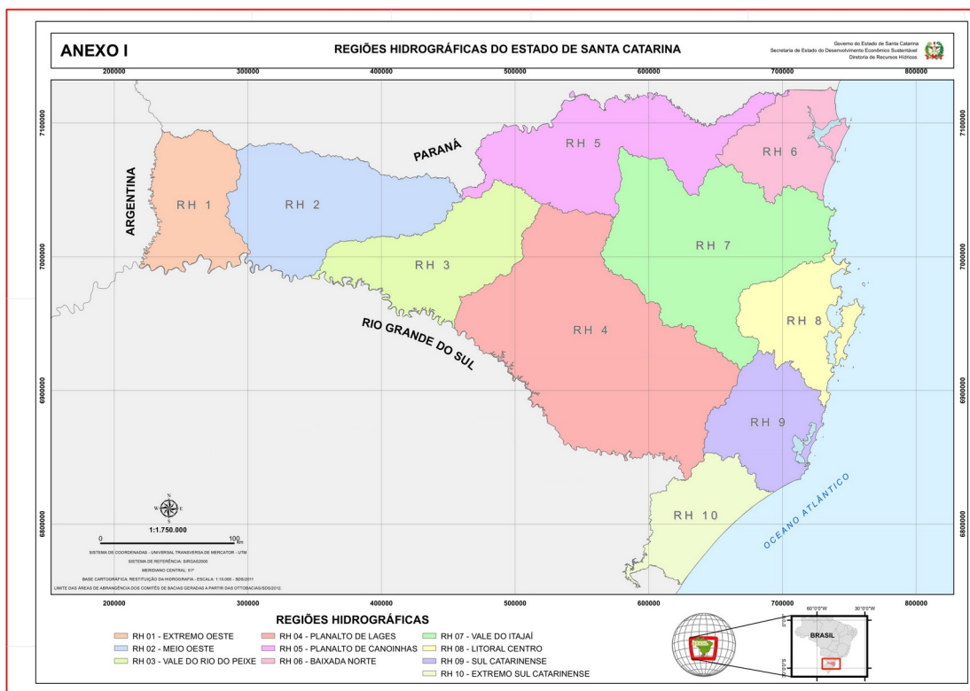
Figura 2: Regiões hidrográficas do Estado de Santa Catarina