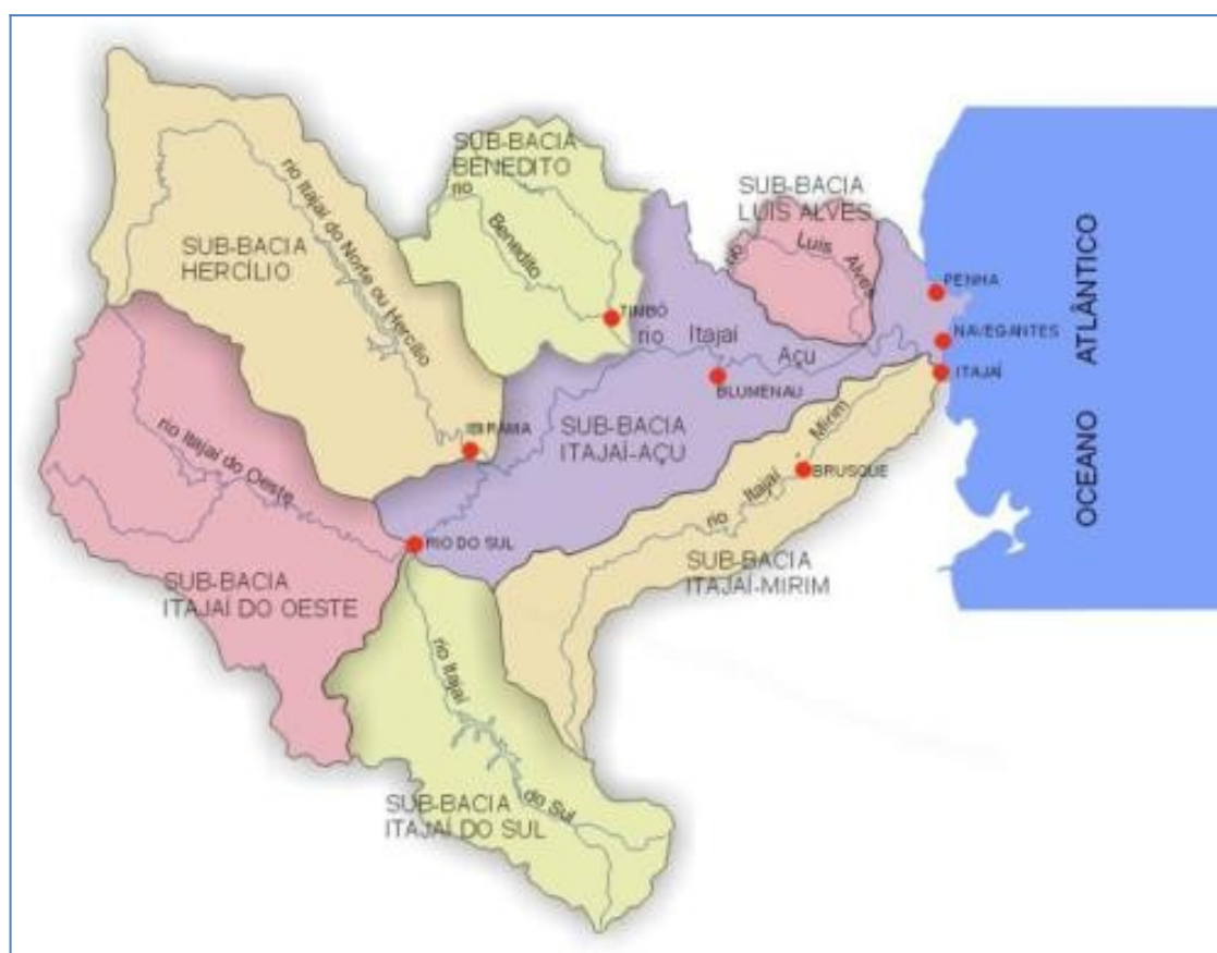
Figura 3: Sub-Bacias do Rio Itajaí